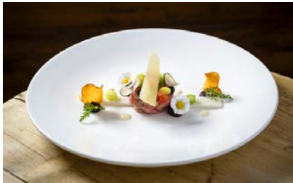
↑ Glücksgerichte: Sonntags gibt es im „Hubertus“ das sechsgängige Lebensessenz-Menü