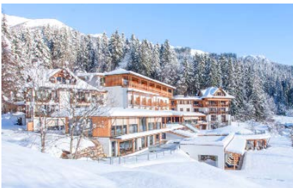
Ruhig gelegen am Waldrand oberhalb des Dorfes St. Daniel im Gailtal im westlichen Kärnten. Man hat von überall einen unverbauten Blick nach Süden

Ich muss dringend runter vom Gas: Stress, Schlafmangel und zu wenig im „Jetzt“ sein, haben nicht nur meinen Körper übersäuert. Auch mein Bewegungsmangel im Alltag macht mich unfroh. Das perfekte Gegenprogramm finde ich im Biohotel „Der Daberer“ in Kärnten. Ich buche das siebentägige Basenfasten-Paket. Gesunder Genuss, Entspannung und Bewegung inklusive. Bereits vor der Reise gibt es wertvolle Infos: So soll ich in der Woche vor der Ankunft vor allem Koffein und Zucker reduzieren, um Entzugserscheinungen zu minimieren. Außerdem soll ich mich möglichst basenreich ernähren. Im Hotel mitten in der Natur gibt es dreimal täglich zu festen Zeiten etwas zu essen. Auf den Tisch kommen liebevoll zubereitete Köstlichkeiten aus viel Obst und Gemüse, die basisch verstoffwechselt werden. Säurebildner wie Fleisch und Getreide sind dagegen tabu. Aciflovital zum Frühstück und ein Basen-Mineralpulver nach dem Mittagessen entlas-