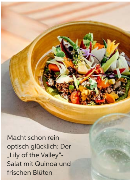
Macht schon rein optisch glücklich: Der „Lily of the Valley“-Salat mit Quinoa und frischen Blüten