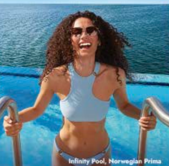
Infinity Pool, Norwegian Prima

50% AUF KREUZFAHRTEN, FLUGRABATT & MEHR*