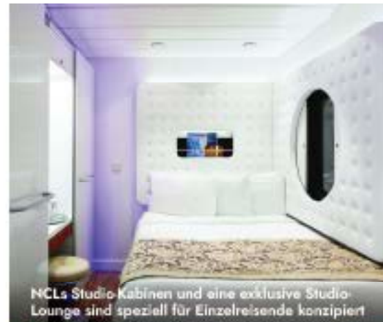
NCLs Studio-Kabinen und eine exklusive Studio-Lounge sind speziell für Einzelreisende konzipiert